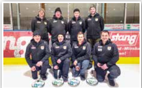
Sportjacken der Stockschützen