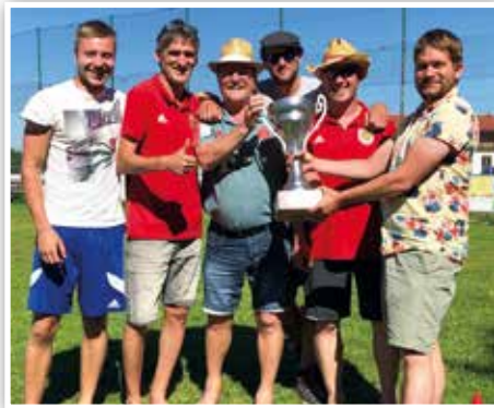
Die Veranstalter und das Gewinnerteam: „Gefühlte 300“.

Der Wettbewerb bestand aus 8. Mannschaften je 3 Leute. Das Turnier startete um 12:27 Uhr. Startgebühr waren: 9,96 € und gespielt wurde am DJK Darching Stockschützenheim.