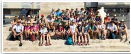
Gruppenbild der Ministranten in Rom

Eine ereignisreiche Woche stand an. Neben dem diözesanen Eröffnungsgottesdienst mit Weihbischof Wolfgang Bischof, dem Blind Date, bei dem man mit anderen Diözesen in Kontakt kam, und dem Abschlussgottesdienst mit Reinhard Kardinal Marx standen viele weitere Besichtigungen auf dem Plan. So besuchten wir die klassischen Touristenziele wie die Spanische Treppe, den Trevi-Brunnen, die Piazza Navona und das Pantheon. Ein zusätzliches Highlight war natürlich der Besuch des Kolosseums, das wohl bekanntestes Wahrzeichen der Stadt. Es wurden auch zwei Führungen gebucht: bei der „Stadt des Wassers“-Führung konnte man unterirdisch ein Stück römische Geschichte erleben, die Katakomben hingegen konnte man bei einer Führung durch die St. Calixtus Katakomben bestaunen. Auch ein Besuch am Meer und freie Zeit zum Shoppen durften selbstverständlich nicht fehlen. Die Papstaudienz am Dienstagnachmittag war etwas ganz Besonderes. Bei sengender Hitze warteten wir auf Papst Franziskus, der zweimal mit dem Papamobil direkt an uns vorbeifuhr. Er betonte,