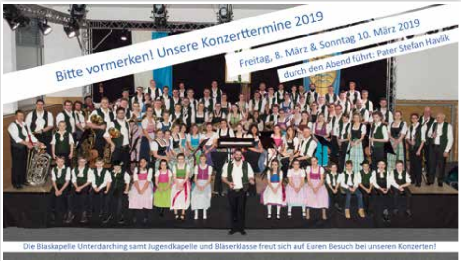
Die Blaskapelle Unterdarching samt Jugendkapelle und Bläserklasse freut sich auf Euren Besuch bei unseren Konzerten!

Wanderung durch einen Lärchenwald und einer Besichtigung eines alten Berghofes führten uns die Gastgeber weiter ins Mühltal. Dort warteten schon weitere Musikanten der Musikkapelle St. Martin in Thurn mit Südtiroler Spezialitäten auf uns, die natürlich verkostet wurden. Den Abend ließen wir dann zusammen mit der Blaskapelle aus St. Martin in Thurn in unserem Hotel zünftig ausklingen. Am nächsten Morgen durften wir eine kleine Klangprobe im Südtiroler Proberaum abhalten und anschließend wieder ins 8 km entfernte Campill fahren. Dort fand zur Feier der örtlichen Kirchweih ein kleines Fest statt, auf dem wir am Nachmittag im Festzelt für die Besucher spielen durften.