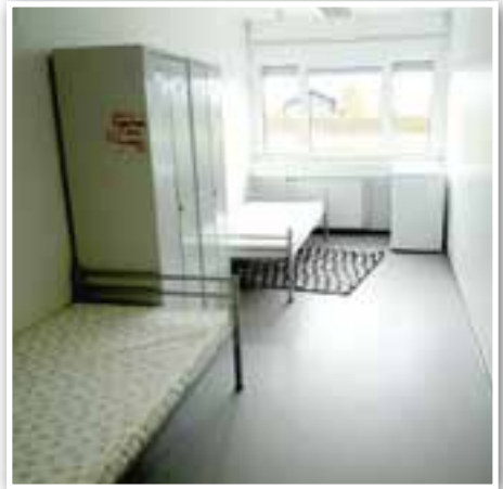
Helle, freundliche Zimmer erwarten die Asylbewerber

Zu dem gut organisierten Helferkreis in Valley gehören bereits jetzt über 70 Personen. Arbeitsgruppen organisieren zum Beispiel die medizinische Versorgung, Fahrgelegenheiten zum Einkaufen und Deutschkurse, außerdem kümmern sie sich um Arbeitsplätze für diejenigen, die anerkannt werden und ein Bleiberecht erhalten. Und was sagt die Valleyer Bevölkerung