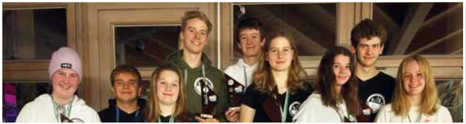
von den Vereinsmeister/innen