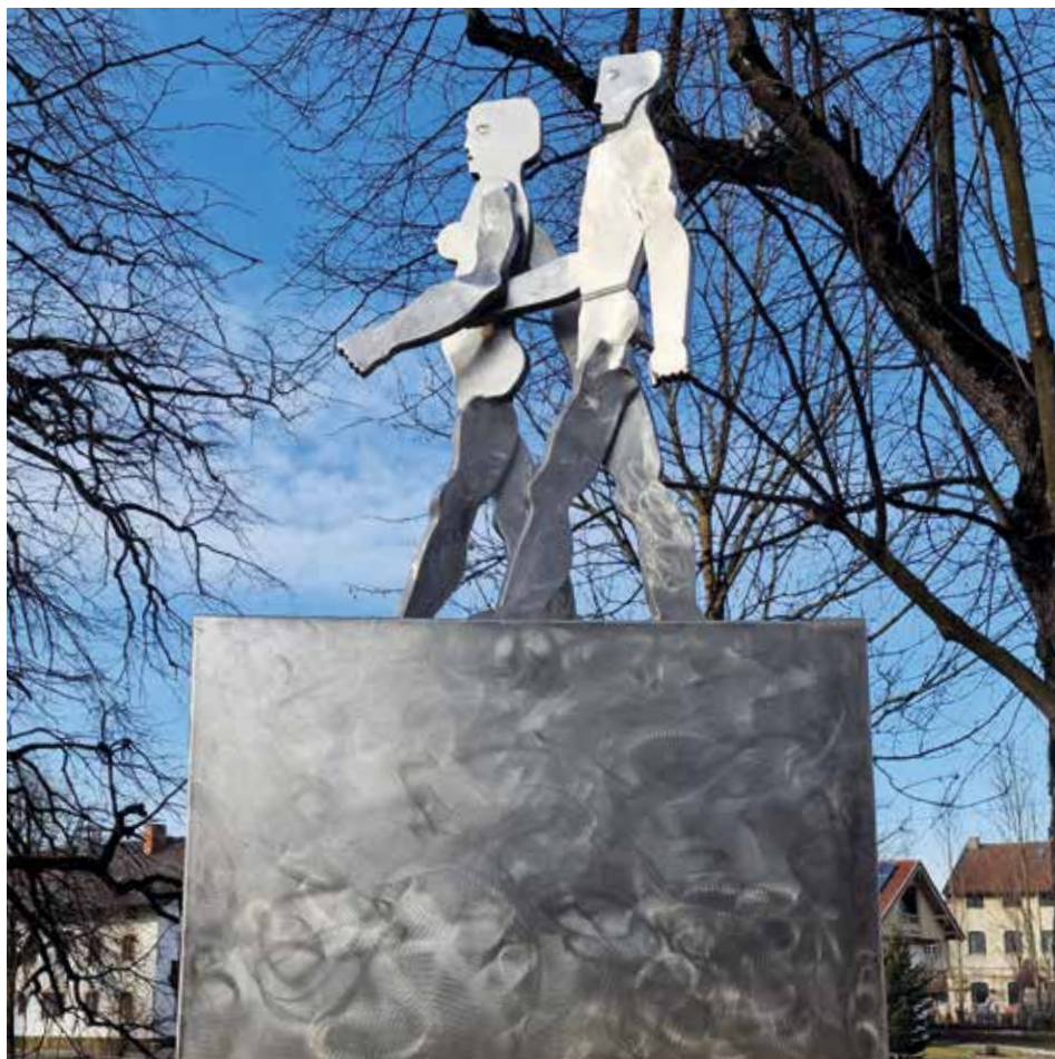
Foto: Doreen Impekoven – Das Schreitende Paar von Karl-Jakob Schwalbach