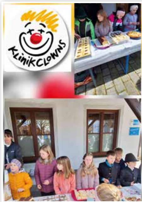
Kinder Fastenaktion 2026 Kommunionkinder aus Unter und Oberdarching verkaufen nach der Sonntagsmesse Suppe und Kuchen zur Unterstützung der Klinik Clowns 691,40€ Vergelt's Gott allen HelferInnen!

Ein erstes Kennenlernspiel unter dem Motto „Finde einen Ministranten, eine Ministrantin, der, die ...“ brachte Bewegung in die Gruppe und sorgte für neue Begegnungen.