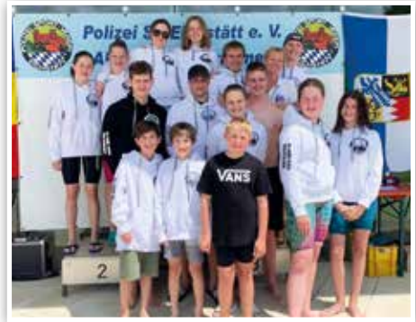
Teilnehmer des SV GW Holzkirchen