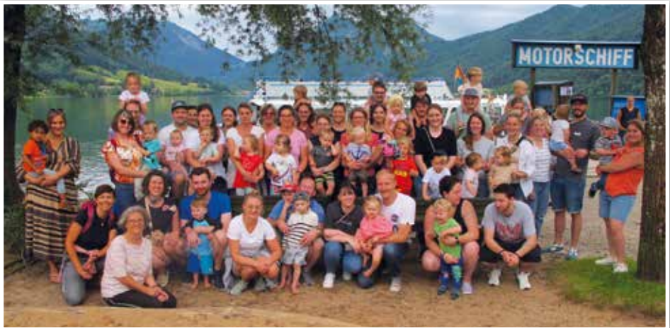
Mit Mamas und Papas an den Schliersee

Wir freuen uns auf den Start in ein neues Kinderstubenjahr und eine gute Zusammenarbeit mit den Eltern und vor allem auf die Kinder.